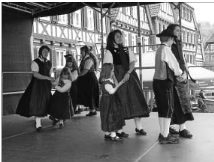
Die Kinder- und Jugendgruppe beim "Knopfloch" auf dem Bauernmarkt in Calw.