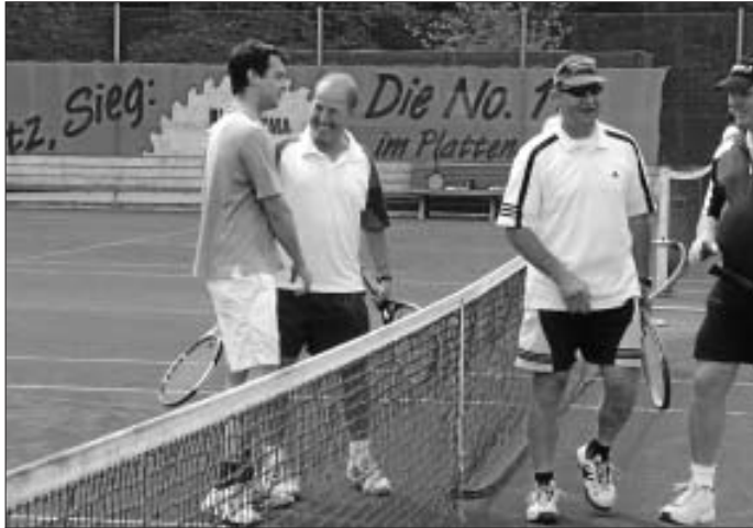
Gratulation nach dem Spiel ! Mit einem Lachen auf beiden Seiten.

Zwischenzeitlich kamen die Holzbronner Liederkranspatzen vorbei und erfreuten die erschöpften Tennisspieler mit einer erfrischenden Gesangseinlage. Euch vielen Dank dafür. Ein herzliches Dankeschön auch für die vielen Helfer im Hintergrund, die diesen Tag wieder einmal zu einem besonders gelungenem machten.