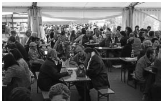
Blick ins Festzelt der Trachtenkapelle Altburg in Oberriedt.

An Köstlichkeiten gab es allerlei, wobei den Backwaren besonders große Aufmerksamkeit geschenkt wurde. Während sich am Nachmittag die Frühaufsteher an der ausladenden Kuchentheke bedienten, genossen andere ein warmes Mittagessen oder einen Imbiss in Form von Pizza, Flammkuchen oder Bratwurst. In der Zwischenzeit bezogen die Musikkameraden aus Simmersfeld die Bühne und sorgten zwei weitere Stunden für Unterhaltung. Die Zeit verging wie im Flug und mit der Dämmerung schloss auch die Pilsbar - dem traditionell zu letzt schließenden Ausschank vor dem Zelt.