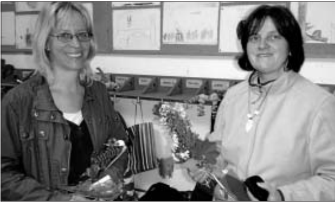
Liebe Kinder, liebe Erzieherinnen: Vielen Dank für das modische Accessoire!