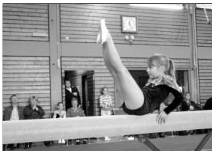
Die Turner und Turnerinnen vom TVA wollen in der heimischen Schwarzwaldhalle gute Ergebnisse erzielen.

Der Turnverein lädt alle Mitglieder und die Bevölkerung zu einem sportlichen Tag in und um die Schwarzwaldhalle ein. Die Veranstaltung ist bewirtschaftet mit Essen vom Grill und Kaffee und Kuchen. Wir freuen uns über Ihren Besuch.