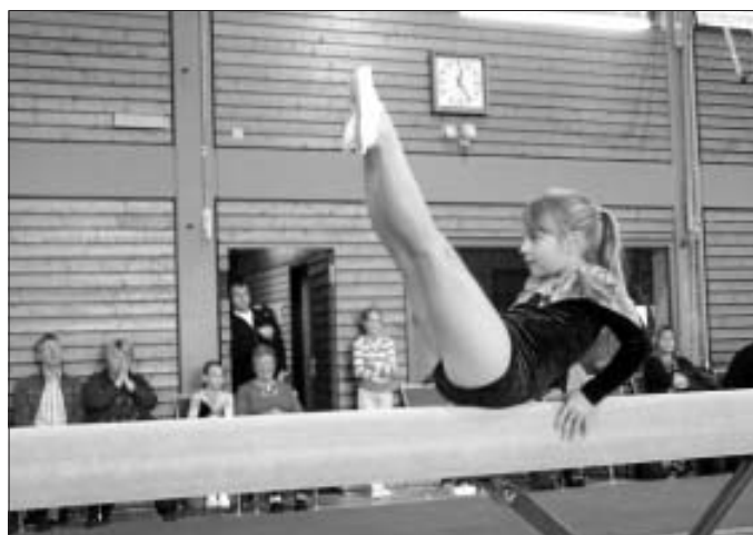
Die Turner und Turnerinnen vom TVA wollen in der heimischen Schwarzwaldhalle gute Ergebnisse erzielen.

Der Turnverein lädt alle Mitglieder und die Bevölkerung zu einem sportlichen Tag in und um die Schwarzwaldhalle ein. Die Veranstaltung ist bewirtschaftet mit Essen vom Grill und Kaffee und Kuchen. Wir freuen uns über Ihren Besuch.