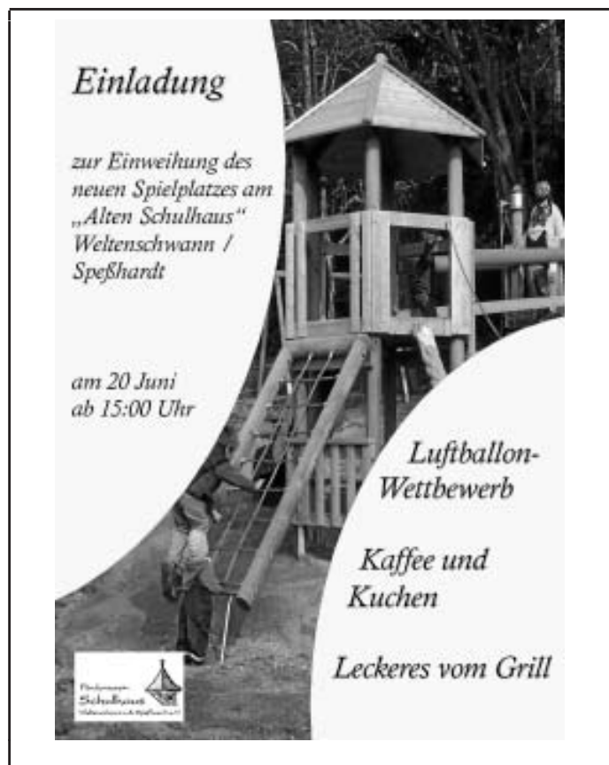
Spielplatzeinweihung am 20. Juni ab 15 Uhr

Weitere Informationen, Termine und Fotos auch hier: www.schulhauswespe.blogspot.com