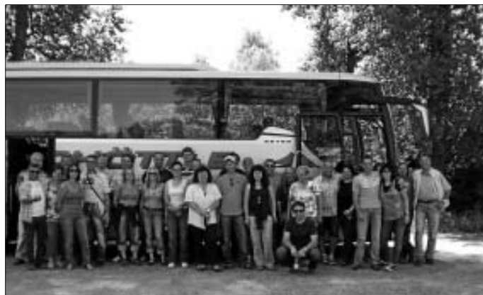
Einen schönen Tag erlebten die AH-Fußballer mit ihren Frauen bei ihrem Ausflug im Naturschutzgebiet in Taubergsessen