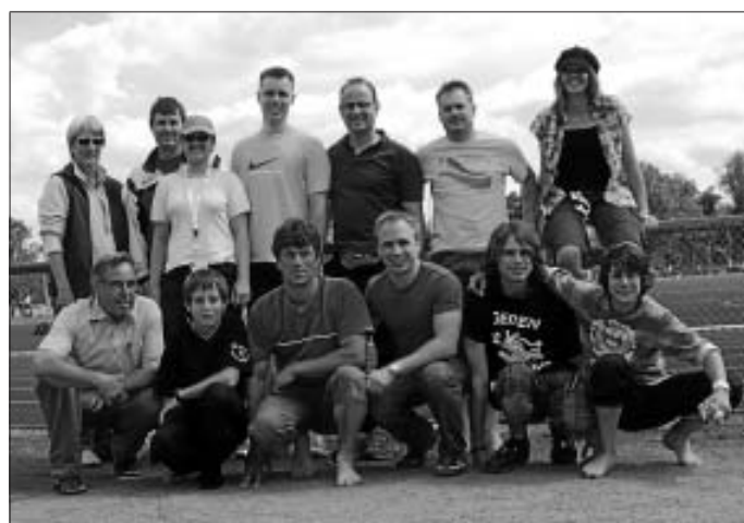
Die Altburger Teilnehmer hatten viel Spaß in Frankfurt

Vom 30.5 bis zum 5.6 fand in Frankfurt am Main das internationale Deutsche Turnfest statt. Der TV Altburg war mit dabei! Am Samstag fand der große Festzug statt, in dem sich auch die Altburger Teilnehmer mit der Vereinsfahne präsentierten. Am Abend fand rund um die extra aufgebaute Seebühne - mitten auf dem Main - eine große Eröffnungsveranstaltung mit beeindruckender Licht- und Wassershow statt. Die Altburger Teilnehmer genossen die Woche in Frankfurt sehr. Einige sammelten neue Erfahrungen bei der Turnfest-Akademie bei der die neusten Trends für die Übungsgruppen im Verein vorgestellt wurden. Auf den Showbühnen in der Stadt zeigten viele Gruppen ihr Können und beeindruckten damit auch die Altburger. Ein weiterer Höhepunkt