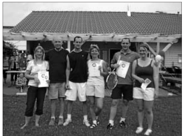
Unsere Finalisten !

Anderthalb Tage gaben jede Menge Raum für aufregende Tennis-spiele und Spielspaß. Lieben Dank den Organisatoren und Teilnehmern.