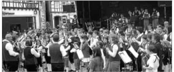
Ein tolles Bild boten die Jugendlichen aus Calw, Altburg und Stammheim sowie den Bläserklassen beim gemeinsamen Massenchor.

Außerdem möchten wir dem Organisationsteam danken. Sie haben sich in zahlreichen gemeinsamen Sitzungen auf diese Veranstaltung vorbereitet.