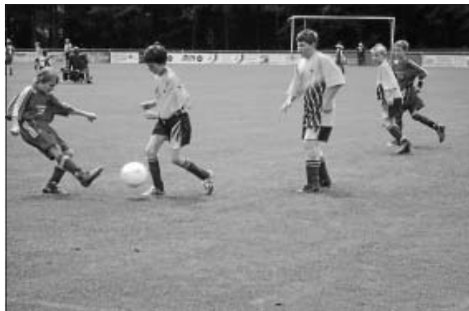
Altburger Jugendturnier 2009