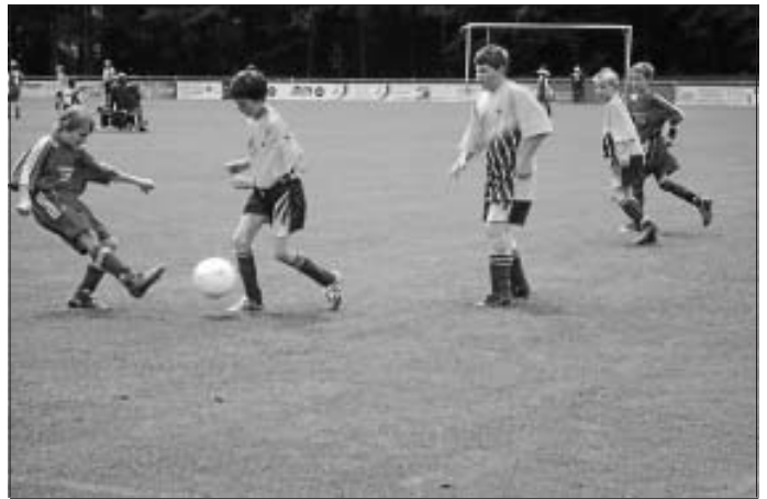
Altburger Jugendturnier 2009