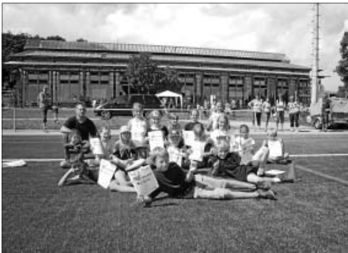
TAV Teilnehmer nach der Siegerehrung

Die 30 Kinder vom TVA haben am Sonntag, 5. Juli beim Gau-Kinderturnfest in Gechingen mit viel Spaß teilgenommen und erlebten einen tollen Tag mit Sportangeboten in der und rund um die Schlehengäuhalle.