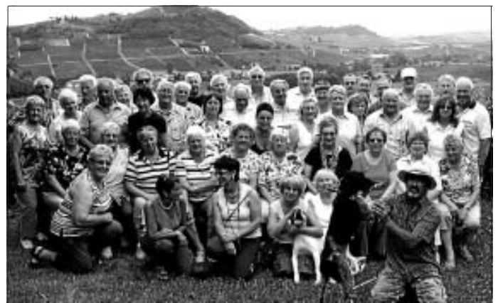
Reisegruppe mit Trüffelsucher und dessen Hunde

Der Obst- und Gartenbauverein Stammheim ist auch 2009 auf Tour. In das Traumland der Romantiker und Genießer - in das Verdi-Land Italien. Alba, die Hauptstadt des weißen Trüffels trägt den Beinamen "Stadt der hundert Türme". Heute ist nur noch ein kleiner Teil der schönen roten "Geschlechtertürme" erhalten, diese prägen das Stadtbild. Pollenzo, im Hof des Albertinischen Komplexes, der Agenzia ist heute die von Slow Food betriebene Univer-