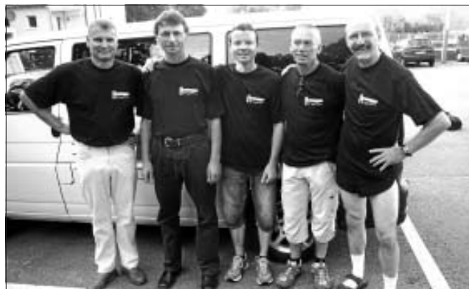
Altburger Team nach erfolgreichem Rennen