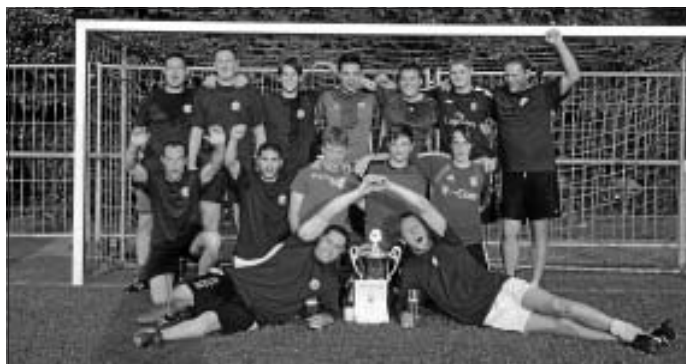
Die beiden Finalteams des Altburger Fleckenturniers 2009

Bereits zum 3. mal fand das alljährliche Fleckenturnier des 1. FC Altburg bei herrlichem Sommerwetter statt. Bei sehr guter Stimmung auf und neben dem Fußballplatz kämpften insgesamt 11 Hobbyteams aus Altburg und Umgebung um den diesjährigen Turniersieg. Im Spiel um Platz 3 setzte sich die Mannschaft aus Welten schwann gegen den Tischtennis Verein Altburg im Neunmeter schießen durch. Im Finale gewann das Team der Power Puff Boys 1:0 gegen die Mannschaft vom Di'Öx und sicherten sich so den hartumkämpften Pokal.