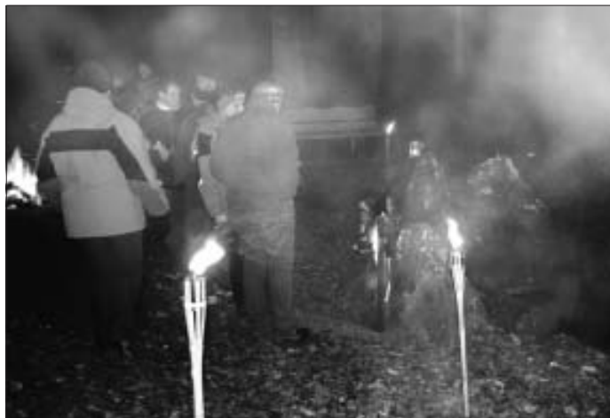
Am Brünnele ist es im Fackelschein sehr heimelig