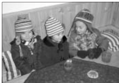
Auf der Heinzelmänn(d)chenbank

Nachts, in der Vorweihnachtszeit, kommen sie manchmal heute noch zu den Menschen, vorzugsweise zu den Kindern: die Heinzelmännchen. Sie messen und sägen, bohren und dreheln, schleifen und feilen, dübeln und passen ein, verleimen und streichen; sie bringen Tuchrollen, messen ab und schneiden zu, nähen und säumen, füllen und steppen ab, dass es nurso "hummelt" und "groht". Sie schleichen leise, ganz leise - es soll ja eine Überraschung werden - in den Kindergarten und bauen eine Vesperecke neben der Küche ein: eine hölzerne Eckbank, mit Kissen weich gepolstert.