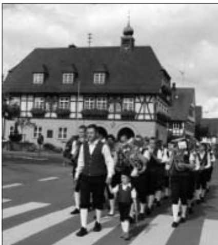
Die Jugendkapelle beim Einmarsch.

Am vergangenen Wochenende veranstaltete der Musikverein zum dritten Mal den Kulinarischen Marktplatz.