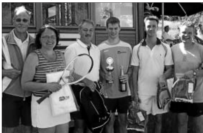
Die Sieger des Turnieres.

Bei idealem Tenniswetter konnte der TCS das 4. Stammheim Open Turnier durchführen. Angemeldet hatten sich ausreichend viele Doppel, bei denen jeweils ein aktiver Spieler dabei sein durfte. Erst wurde in den Gruppen gegeneinander gespielt, und zur Zwischenrunde hatten es die jeweiligen Platzierten dann im direkten "Kampf" miteinander zu tun. Nach dem gemeinsamen Mittagessen wurden die Plätze ausgespielt und gegen 16 Uhr stand der neue Turniersieger mit dem Hammer-Team fest. Zweitplatziertes war das Riegeläcker-Team und das Sänger-Team konnte sich den 3. Platz erkämpfen. Bei der Siegerehrung übergab A. Kopanski den Wanderpokal an die Sieger mit der Teilnahmezusicherung für das nächste Jahr. Weiterhin bekamen die "Treppchensieger" die gestifteten Preise von der ENCW. Es war wieder mal eine gelungene Veranstaltung des TCS im Winkeltal, die im nächsten Jahr seine 5. Wiederholung finden soll.