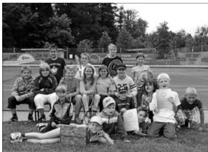
Unsere Akteure der Jugend- und Bambinimeisterschaften

Vom 10-12. August findet unser Training für Kinder und Jugendliche statt. Wir möchten Euch bitten, bereits 13:45 Uhr am Tennisplatz zu sein. Wir wünschen Euch viel Erfolg und Spaß und schönes Wetter.