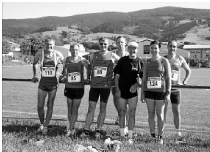
Sonnige Zeiten für die Altburger Läufer