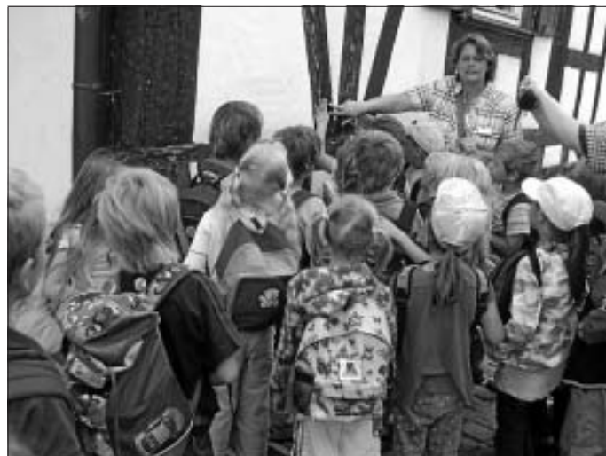
Typisch für Calw - die vielen Fachwerkhäuser

Fragen Sie einfach die Vorschulkinder aus Weltenschwann-Speßhardt und Altburg, die kennen sich aus. Seit ihnen Andrea Olt-