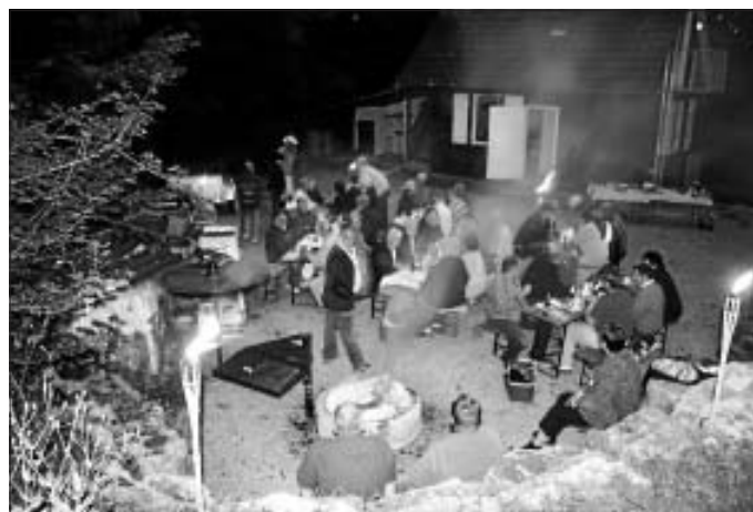
Am Adlerhorst fühlten sich alle richtig wohl.

Einen strahlenden Sommertag wünschen wir uns nun auch für den 23. August. Dann wird unser Waldfest am Rehgrundbrünnele für alle Besucher wieder ein schönes Erlebnis. Bis dahin wünschen wir allen Mitgliedern und Freunden erst mal schöne Ferientage.