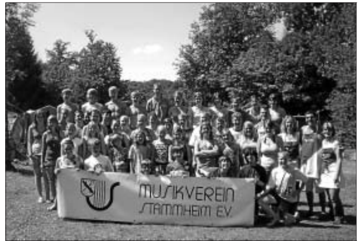
Die Teilnehmer des diesjährigen Zeltlagers am Neumühlsee.