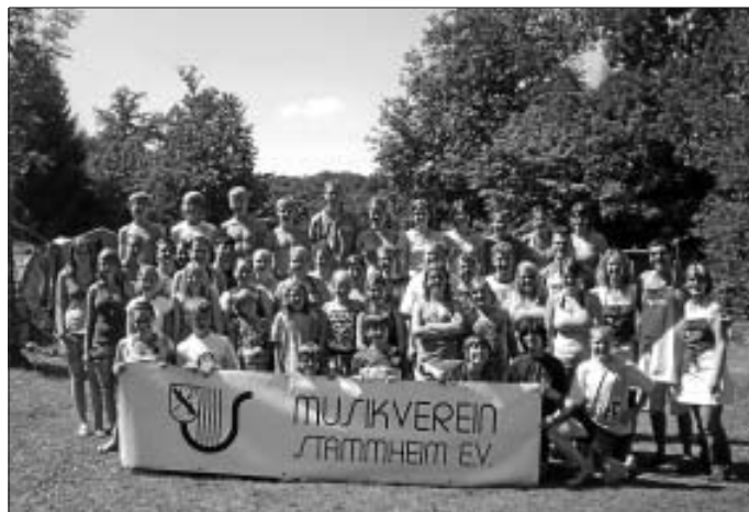
Die Teilnehmer des diesjährigen Zeltlagers am Neumühlsee.