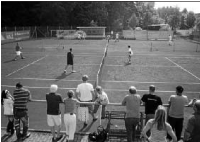
Platz voller Leben - so muss das sein !

Alle aktiven Spieler sind herzlich zu unserer diesjährigen Vereinsmeisterschaft eingeladen. Los geht es am Samstag, dem 12.9. 13 Uhr. Zu diesem Zeitpunkt müssen alle Teilnehmer spielbereit auf der Anlage zugegen sein. Weiter geht es dann am Sonntag ab 9 Uhr. Gespielt wird über zwei Gewinnsätze ohne Vorteilsregelung. Sollte ein dritter Satz notwendig sein, wird dieser als TieBreak ausgeführt. Als Neuerung wird es in diesem Jahr eine Altersunterteilung in Spieler unter bzw. über 50 Jahre geben. Selbstverständlich können die 50+ Spieler auch bei den Junioren 50- antreten. Wer mitmachen möchte, trägt sich bitte bis zum 10.9. in die ausgehangene Liste am Tennisheim ein. Wir wünschen uns zahlreiche Spieler und Euch erfolgreiche Begegnungen!