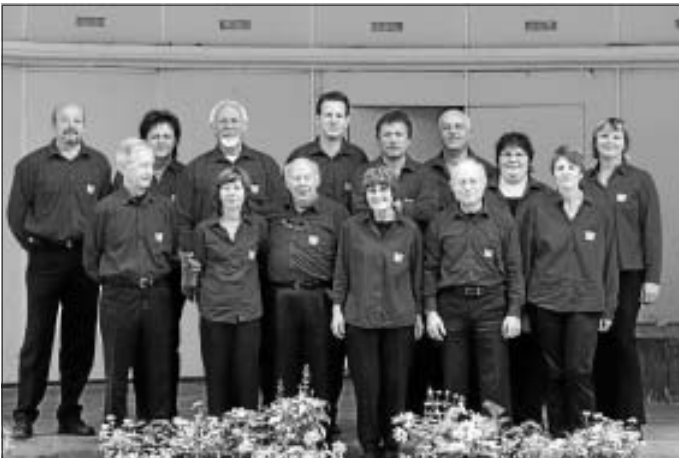
eine coole Truppe,

bereitet sich für das Highlight am 14. November vor. Der Harmonika Verein gestaltet mit dem Liederkranz Hirsau einen gemeinsamen Unterhaltungsabend der unter dem Motto "Musik ist Trumpf" im Kursaal Hirsau, steht.