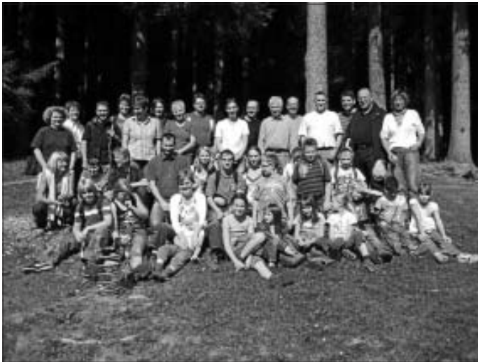
Der Liederkranz auf Wanderschaft

Einen schönen Ausflug erlebten die großen und kleinen Sänger des Liederkranzes am vergangenen Samstag. Das Wetter spielte mit, so dass das Wandern von Baiersbronn am Sankenbach entlang zum Grillplatz am See, vorbei an einem Wasserfall bis zur Glasmännlehütte, wo wir mit einer traumhaften Aussicht belohnt wurden, viel Freude bereite.