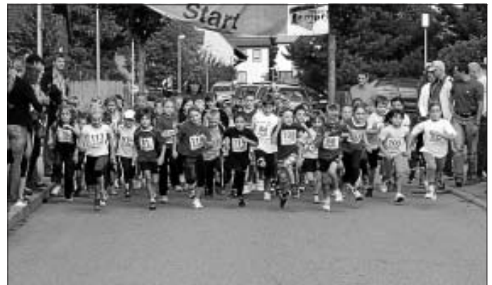
Nachwuchsläufer am Start

Kontaktadresse: Georg Stoll 07051/50802, weitere Infos unter www.laltburg.de