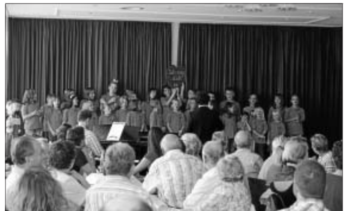
Die Liederkranz Spatzen im gut besuchten Dorfsaal Holzbronn

Eine zusätzliche Probe findet für den Männerchor am Samstag, den 10.10. ab 10.00 Uhr bis 16.00 Uhr statt.