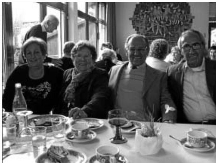
Die Besucher des Seniorennachmittags der kath. Kirchengemeinde erlebten einen vergnüglichen Nachmittag.

Unter diesem Motto hat die katholische Kirchengemeinde St. Josef alle älteren Gemeindemitglieder ihrer großen Pfarrei zum Seniorennachmittag eingeladen. Vorausgegangen war eine feierliche Eucharistiefeier, in der das Sakrament der Krankensalbung gespendet wurde. Danach ging es im Gemeindehaus auch wirklich lustig zu.