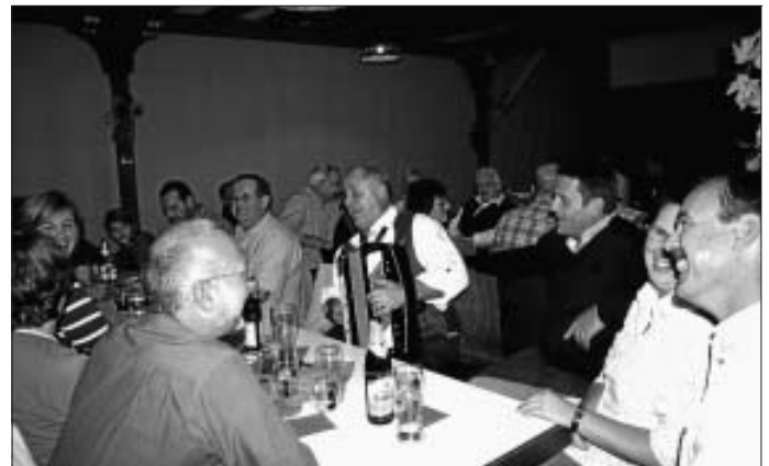
Musiker können nicht nur Instrumente spielen!

Wir haben uns große Mühe gegeben: Das erste Drittel der Gemeindehalle erhielt herbstliches Ambiente. Die umrankte Weinlaube wurde mit Korblampen gemütlich beleuchtet und über den Tischen davor hingen bunte Lampions, die eine entspannte Atmosphäre schufen. Die Gäste konnten also kommen! Und tatsächlich trafen pünktlich um 18 Uhr die ersten ein - trotz des noch laufenden Fußball-Länderspiels. Stetig füllten sich die einladend geschmückten Tische, und schnell wurden Getränke serviert und die ersten Essen aus der Küche geliefert. Schlachtplatte, Schnitzel oder Wurstsalat mundete den Gästen. Als "Nachtisch" ließen sich viele noch leckeren Zwiebelkuchen schmecken. Dazu ein neuer Wein - einfach himmlisch!