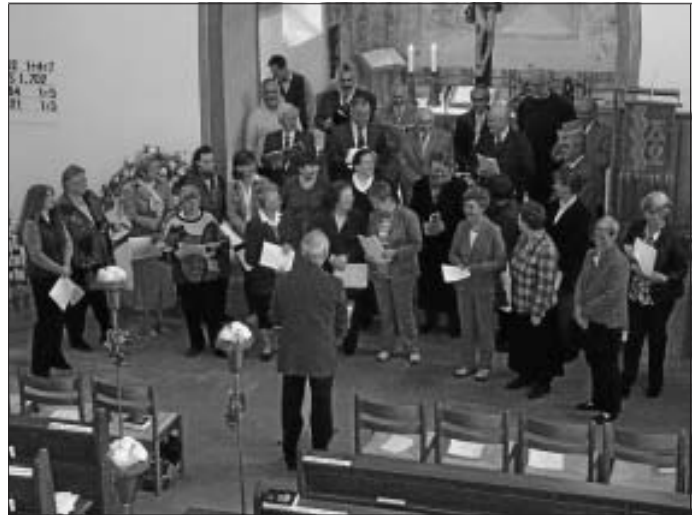
Ökumenischer Gottesdienst am Sonntag, den 11. Oktober

für die Erntegaben die den Altarraum beim Erntedankgottesdienst geschmückt haben. Das Küchenteam bedankt sich für die zahlreichen Besucher die zum Mittagessen ins Gemeindehaus gekommen sind. Der Erlös konnte für die Brandkatastrophe in der Erlacher Höhe weitergeleitet werden. Herzlichen Dank an alle die das ermöglicht haben.