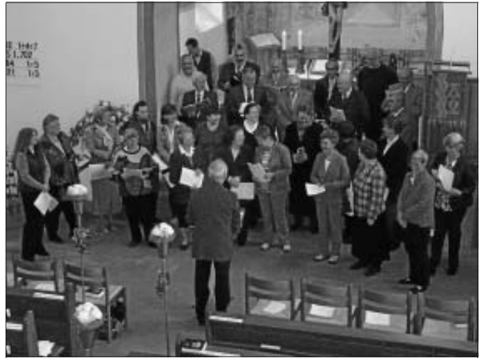
Ökumenischer Gottesdienst am Sonntag, den 11. Oktober

für die Erntegaben die den Altarraum beim Erntedankgottesdienst geschmückt haben. Das Küchenteam bedankt sich für die zahlreichen Besucher die zum Mittagessen ins Gemeindehaus gekommen sind. Der Erlös konnte für die Brandkatastrophe in der Erlacher Höhe weitergeleitet werden. Herzlichen Dank an alle die das ermöglicht haben.