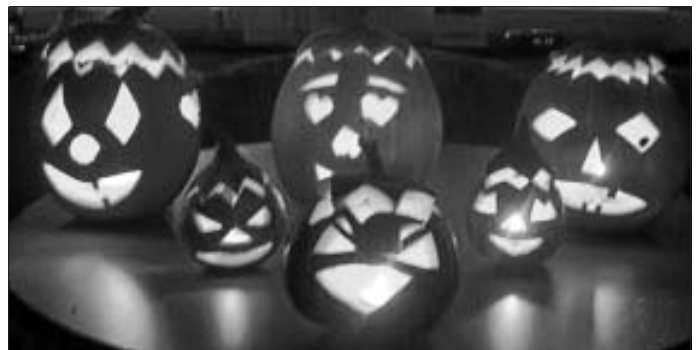
Fröhlich, gruselig, grinsend oder furchterregend?

Gebühr: 4 € für Mitglieder des Fördervereins bzw. 5 € für Nichtmitglieder, darin ist ein Kürbis enthalten. Weitere Kürbisse können vor Ort gekauft werden.