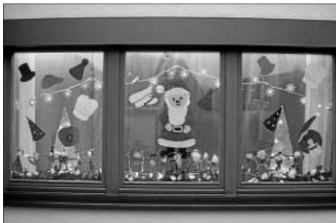
Adventsfenster Kindergarten Willy-Reichert-Straße vom 06.12.2007

Die Planungen für den diesjährigen Altburger Adventskalenderweg sind in vollem Gange. Damit es nicht nur ein Adventsweg, sondern eben ein Adventskalenderweg wird, hier noch einmal unser Aufruf zum Mitmachen an Haushalte, Hausgemeinschaften, Nachbargruppen, Jugendliquen oder feste Gruppen, Vereine, usw. sich jetzt bei den untenstehenden Organisatorinnen anzumelden, die auch gerne Fragen beantworten.