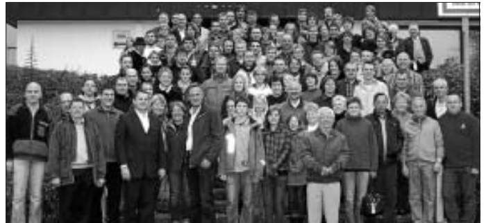
Die Musiker aus Reischach und der Musikverein Stammheim freuen sich auf ein Wiedersehen im nächsten Jahr.

Im Juni kommenden Jahres steht der Gegenbesuch in Reischach auf dem Programm, auf den sich die Stammheimer schon sehr freuen.