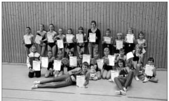
Alle Altburger Teilnehmer nach der Siegerehrung in Neubulach

Am vergangenen Samstag besuchte die Trachtengruppe Altburg zusammen mit der Jugendgruppe den Tanzlehrgang im Kurhaus in Schönmünzach. Es wurden wieder viele neue Tänze einstudiert und Einiges dazu gelernt. Die Jugendgruppe konnte in einem anderen Raum separat neue Kinder- und Jugendtänze erlernen. Nach dem Abendessen ging es dann mit einem offenen Volkstanzen weiter, wobei hier auch die Jugendlichen mit den Erwachsenen tanzen konnten, ihren Spaß hatten und viel Neues dazu lernten. Es wurde wie immer ein langer Abend mit viel Unterhaltung.