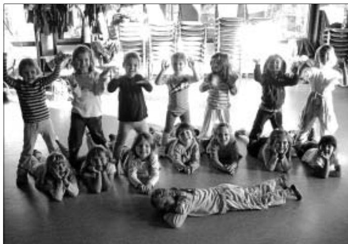
Die Lil' SweetTs haben viel Spaß beim Einüben der Tänze

dem Erlernen der Choreographie. Die Lil' SweetTs haben viel Spaß dabei und freuen sich auf ihre erste Aufführung, welche am 12. Dezember während der Weihnachtsfeier stattfindet