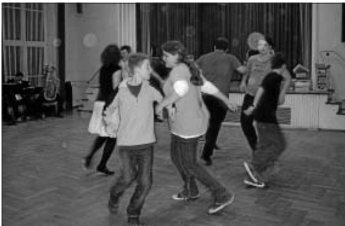
Die Altburger Jugendlichen bei der "Madeleine"