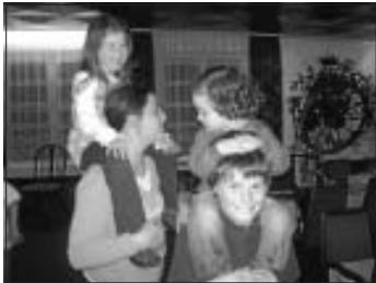
Spiel und Spaß bei der Weihnachtsfeier der Trachtengruppe Altburg

Am Samstag, den 5.12. treffen wir uns ab 17 Uhr im Gasthaus Hirsch in Oberreichenbach zu einem gemütlichen Zusammensein bei Spiel und Spaß. Die Kinder- und Jugendgruppe trifft sich bereits um 15.30 Uhr, um bei einem Winterspaziergang eine Überraschung zu erleben. Wir freuen uns auf viele Besucher.