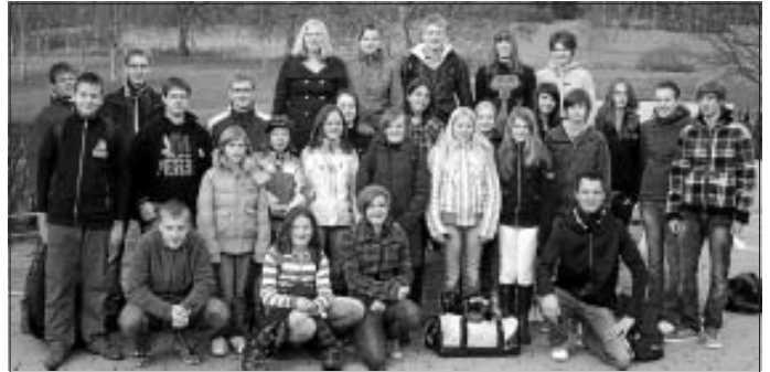
Die Teilnehmer des diesjährigen Badeausfluges ins Badkap nach Albstadt.

Am vergangenen Sonntag zog es 28 Jungsmusikerinnen und Jungsmusiker nach Albstadt ins Erlebnisbad "Badkap". Dort verbrachten sie einen tollen Tag mit Röhrenrutsche, Wildwasserkanal, Wellenbad und beheiztem Außenbecken. Alle hatten sichtlich ihren Spaß und machten sich erschöpft auf die Heimfahrt.