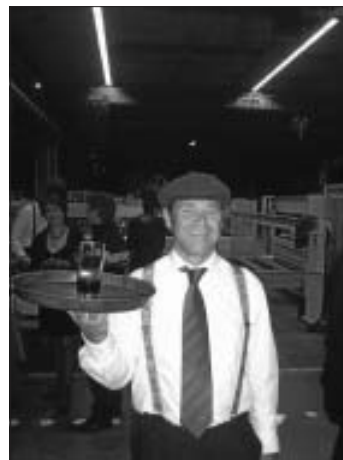
Wir laden gern uns Gäste ein

Wir bedanken uns bei allen Helfern, ob in Küche oder Fabrikhalle aktiv, die zum Gelingen unseres Konzerts in der Firma Holzma beigetragen haben! Ihnen und unseren Gästen eine schöne Adventszeit. Wer diese mit uns erleben möchte, hat am 18. Dezember die Gelegenheit. Vor dem Holzbronner Rathaus findet wieder das 'Singen unter dem Weihnachtsbaum' statt. Wir laden dazu herzlich ein!