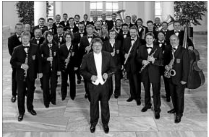
Das Polizeimusikkorps Baden-Württemberg spielt am 30. Januar zu Gunsten der Jugendarbeit des MV Stammheim, der Erlacher Höhe und dem Verein Helfende Hände.

Karten gibt es im Vorverkauf für 10 Euro, an der Abendkasse für 12 Euro. Vorverkaufsstellen: Fachgeschäft Papyrus in Stammheim, Stadtinformation Calw, Möbelladen der Erlacher Höhe in Calw, Musikhaus Raff in Calw und Stammheim.