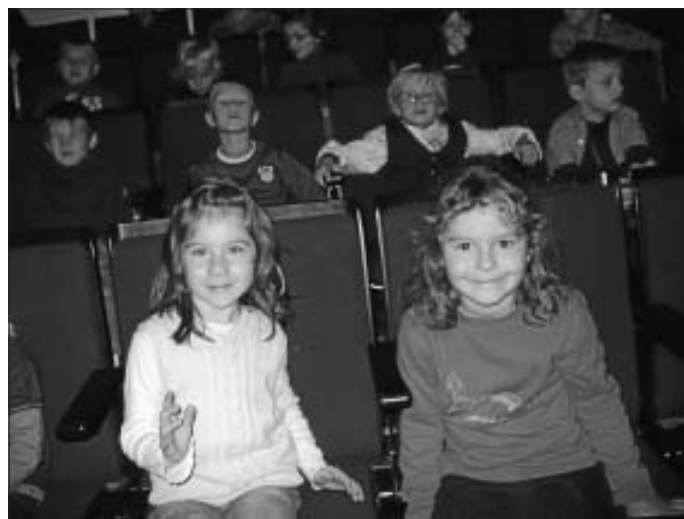
Hoffentlich kriegen wir keine lange Nase!!!

Auf dem Heimweg - wieder mit Bahn und Bus - unterhielten sich die kleinen Theaterbesucher lautstark über den begeisternden Theaterbesuch. Er regte unsere Kinder dazu an, selbst Theater zu spielen und daraus wurde gleich ein kleines Theaterprojekt.