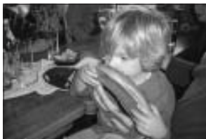
Drei Einser und "Gewonnen"! Frisch schmecken die Brezeln einfach am besten.

Am 31. Dezember sind alle Freunde des Würfelspiels - egal ob jung oder alt - herzlich am Silvesternachmittag ab 13.30 Uhr ins Sportheim am Birkenwäldle eingeladen.