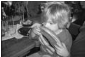
Drei Einser und "Gewonnen"! Frisch schmecken die Brezeln einfach am besten.

Am 31. Dezember sind alle Freunde des Würfelspiels - egal ob jung oder alt - herzlich am Silvesternachmittag ab 13.30 Uhr ins Sportheim am Birkenwäldle eingeladen.