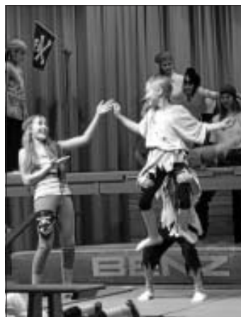
Piraten zeigen ihr Können bei der Weihnachtsfeier des TV Altburg

Die diesjährige Weihnachtsfeier unter dem Motto "Piraten" war ein voller Erfolg. Die Schwarzwaldhalle in Altburg war einen Nachmittag lang fest in den Händen der kleinen Seeräuber. Mit ihren Übungsgruppen zeigten sie in Vorführungen zum Thema Piraten was sie im vergangenen Jahr gelernt haben.