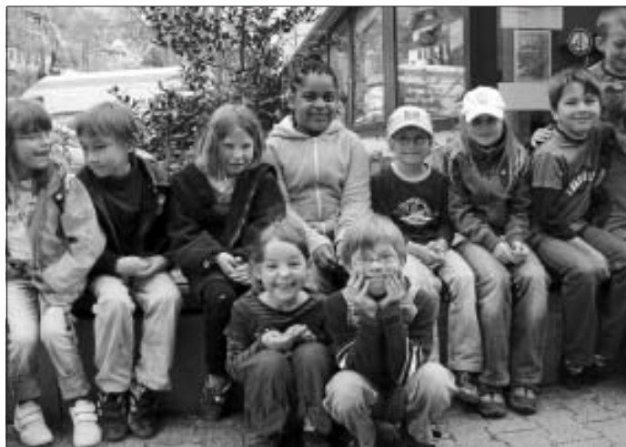
Die Freie Waldorfschule Calw lädt herzlich zum Frühlingsfest und Tag der offenen Tür ein

Um 17 Uhr lädt die EMS ganz herzlich zum Eurythmietheater ein: Gezeigt wird das Märchen "Hans im Glück". Der Eintritt ist frei, über Spenden freut sich jedoch die EMS.