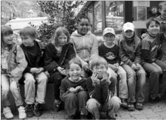
Die Freie Waldorfschule Calw lädt herzlich zum Frühlingsfest und Tag der offenen Tür ein

Um 17 Uhr lädt die EMS ganz herzlich zum Eurythmietheater ein: Gezeigt wird das Märchen "Hans im Glück". Der Eintritt ist frei, über Spenden freut sich jedoch die EMS.