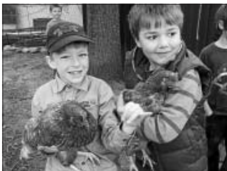
Schulprojekt: Kinder auf dem Bauernhof

Schon im Unterricht beschäftigten sich die Klassen 1 und 2 intensiv mit dem Thema "Bauernhof". Sie erzählten eigene Erlebnisse und notierten sich alle Fragen, die sie auf dem "echten" Bauernhof stellen wollten. Dann ging es los.