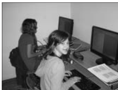
Schüler während der Projektwoche am Computer