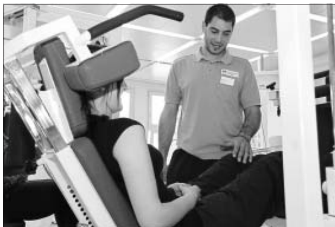
Training im Therapiezentrum

Das Therapiezentrum des Klinikverbundes Südwest (TZ) in den Kliniken Calw hat über den Sommer ein spezielles Angebot: Vom 1. Juli bis 6. September gibt es für Kraft- und Ausdauertraining mit fachlicher Betreuung. Die intensive Betreuung nach medizinischen Gesichtspunkten macht jedes Training effektiv. Dank individueller Trainingspläne trainieren nur so viele Personen gleichzeitig, wie auch tatsächlich aktiv betreut werden können. Kostenloses Probetraining ist selbstverständlich möglich. Nähere Infos unter: Standort Calw, Tel.: 07051 14 42621,