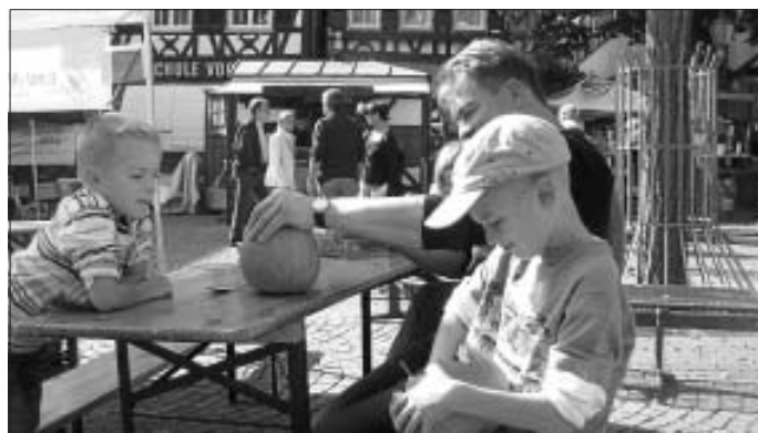
Aushöhlen und lustige Fratzen schnitzen - beim Herbstfest in der Waldorfschule können wieder Kürbisgeister geschnitzt werden.

Informationen zur Freien Waldorfschule Calw, Eduard-Conz-Str. 3a (unterhalb des Calwer Krankenhauses), finden Sie auf der Homepage: www.waldorfschule-calw.de oder telefonisch unter der Nummer: 07051 9686633.