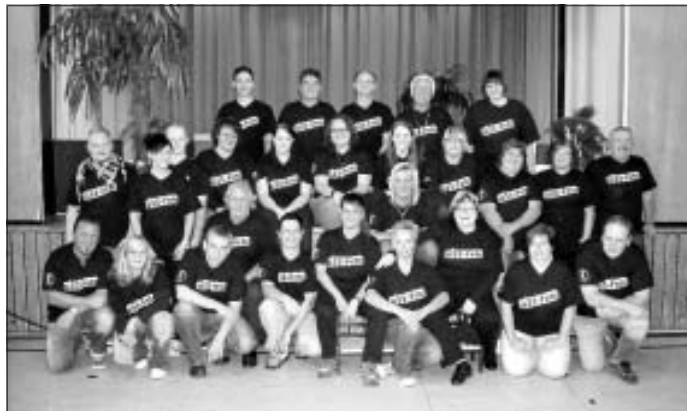
Rückblick: super Stimmung bis in die frühen Morgenstunden

Probe montags und donnerstags von 19 Uhr bis 21 Uhr im Vereinsheim