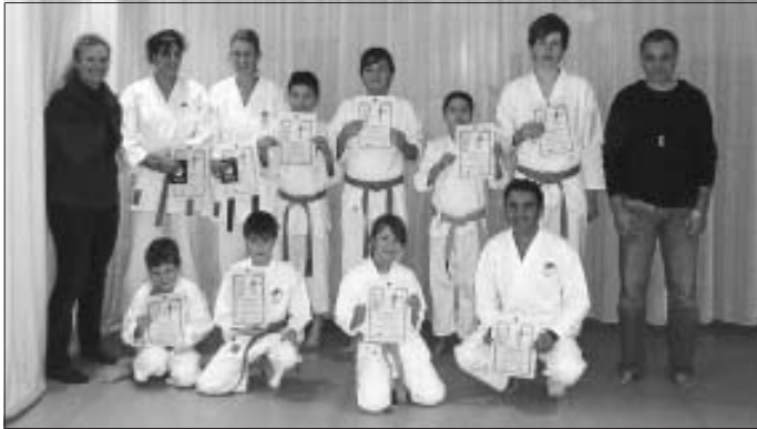
Gut lachen nach einer guten Prüfung.

Eine sehr schöne Prüfung von allen. Herzlichen Glückwunsch!