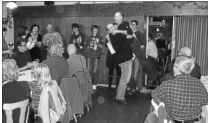
Freude über einen gewonnenen Pokal