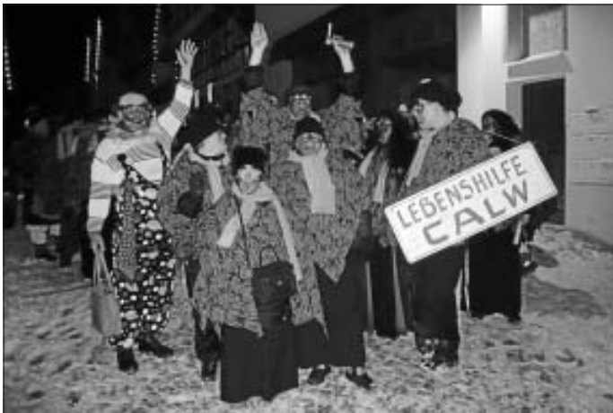
Mittendrin statt nur dabei- die Lebenshilfe Calw e.V. beteiligt sich am Nachtumzug in Calw

Auch dieses Jahr war der Umzug für uns eine Riesengaudi! Wir bedanken uns bei der Calwer Narrenzunft für die herzliche Aufnahme und bei der Lebenshilfe Pforzheim für das Leihen der wunderschönen Kostüme und freuen uns, wenn wir im nächsten Jahr wieder dabei sein dürfen.