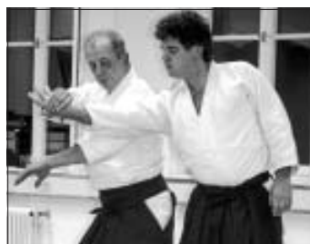
Aikido kennen lernen: Schnupperkurs und Kindertraining

Der Aikido-Club Calw hat einen Frühjahrs-Schnupperkurs gestartet, zu dem der Einstieg noch möglich ist. Der Kurs zum Kennenlernen der Kampfkunst Aikido wird am Freitag, 5. März, ab 19.15 Uhr fortgesetzt. Aikido ist eine moderne Kunst der Selbstverteidigung, deren Techniken aus den traditionellen Kampfkünsten der Samurai entwickelt wurden. Das Training dient der körperlichen Fitness wie der mentalen Stärkung. Besonders geeignet ist Aikido übrigens für Frauen und Mädchen, weil die weiche, aggressionsfreie Kampfkunst wenig Kräfteinsatz erfordert. Der Kurs zum Kennenlernen des Aikido richtet sich an Erwachsene und Jugendliche ab 14 Jahren. Trainingszeit ist jeweils freitags von 19.15 bis 20.45 Uhr. Bitte bequeme Kleidung mitbringen - trainiert wird barfuß oder in Socken. Auch zum Kindertraining jeweils freitags 18 bis 19.15 Uhr sind "Neue" herzlich willkommen. Die Altersgruppe umfasst hier etwa neun bis 13 Jahre. Dreimal kann kostenlos "geschnuppert" werden. Die Trainingsleitung haben Bernd Kappler und das Trainingsteam des Aikido-Clubs Calw. Ort: Tanzraum, zweiter Stock in der Bischofstraße 65, Calw. Interessenten bekommen nähere Infos beim 1. Vorsitzenden Jochen Genthner, Telefon 0172 7237298, oder auf der Website www.aikido.tanzraumcalw.de .