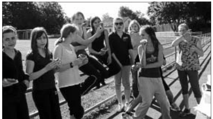
Letztes Jahr sorgte auch der Förderverein wieder für leckere Melonen bei den Bundesjugendspielen

Neben den Berichten des 1. Vorsitzenden und der Kassiererin geht es auch um Neuwahlen und zukünftige Aktivitäten des Fördervereins.