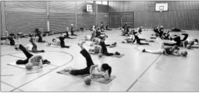
Viel Aktion gab es auch mit dem REDONDO Ball

Bei einem Musikmix aus Hard Rock und House brachte der Redondo die Muskeln an Bauch, Beinen und Gesäß mit vielen kleinen und schnellen "Pushes" auf Höchstleistung. Anschließend bildete Stretching und Entspannung mit einem Hintergrund aus Meeresschäumen den Abschluss.