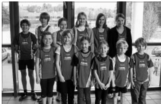
Die erfolgreichen Altburger Leichtathleten nach ihrem Wettkampf in Neubulach

Beim diesjährigen Hallenwettkampf in Neubulach am 28. Februar konnten die Leichtathleten des TV Altburg sehr gute Platzierungen erreichen. Mit 12 Teilnehmern unterschiedlichen Alters gingen wir an den Start. Jeder für sich konnte in den einzelnen Disziplinen 30m- Lauf, Weitsprung, Kugelstoßen oder Ballwurf, sein Bestes zeigen und einige waren mit sehr guten Leistungen dabei. Eure Übungsleiter sind stolz auf eure Ergebnisse und wünschen euch weiterhin viel Erfolg für die nächsten Wettkämpfe.