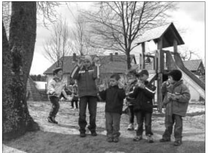
Freude über die Ostergeschenke