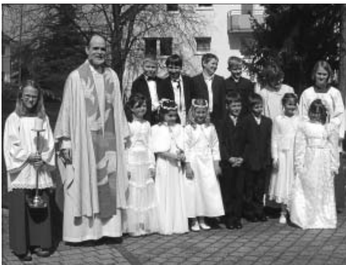
Erstkommunionfeier am Weißen Sonntag in der Kirche Maria-Frieden

Freitag, 23. April 18.30 Uhr Rosenkranz 19 Uhr Eucharistiefeier 19.45 Uhr Ortsausschusssitzung