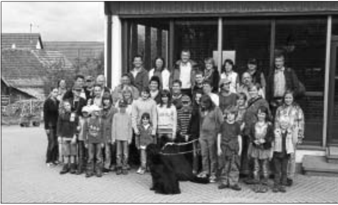
Fröhliche Wanderer vor dem Start in Holzbronn

und Trimm-Dich-Pfad. Fast 50 Wanderer zählte unsere Mannschaft, die bei einem Grillfeuer wieder zu Kräften kam. Auf dem Heimweg lud der Hof Dicke zu einer Stippvisite ein.