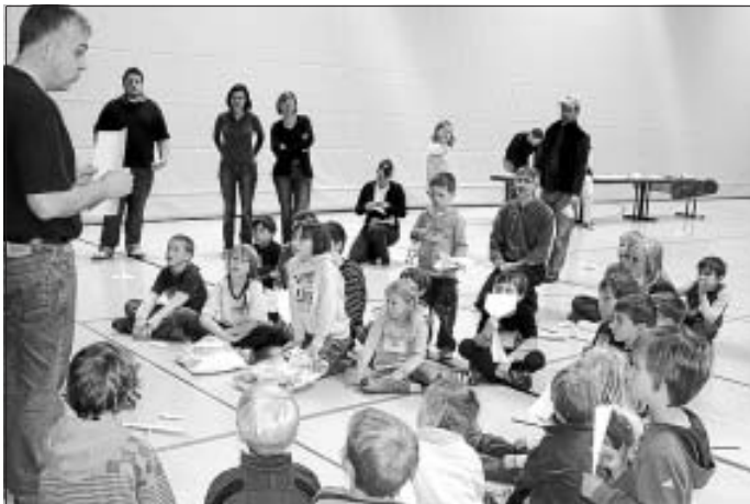
Pilotinnen und Piloten des 4. Papierfliegerwettbewerbs hoch konzentriert beim Briefing

Ein herzliches Dankeschön allen aktiven Teilnehmern und den zahlreichen Helfern.