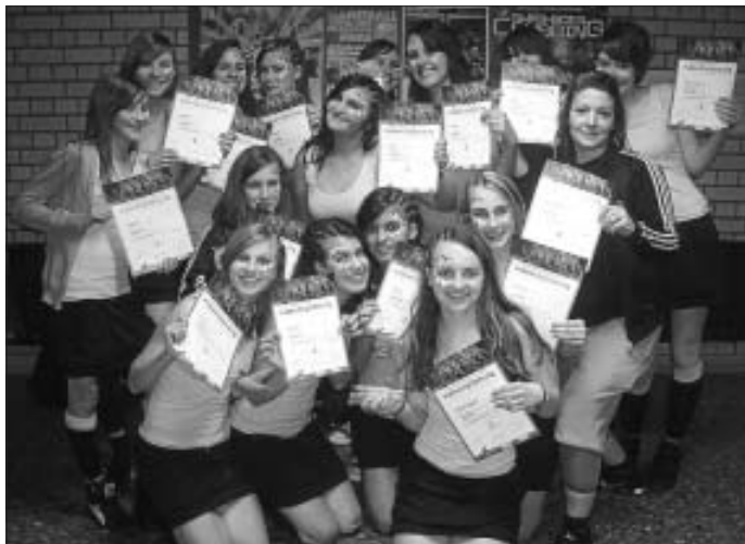
Stolz konnten die AMOUNT GIRLZ bei ihrer Meisterschaftspremiere die Süddeutsche Vizemeisterschaft feiern.

Um 22 Uhr nach fast 10 Stunden Aktion standen die Ergebnisse der Mühen fest. Der Turnverein Altburg beheimatet nun zwei Süddeutscher Vizemeister Formationen mit "DA JUMBLE" in der Meister-Reihe und den "AMOUNT GIRLZ" in der A-Reihe jeweils im VideoClip-Style.