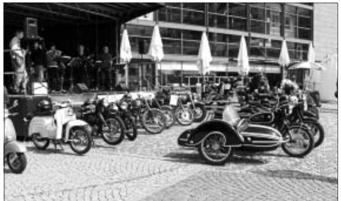
3. Calwer Biker-Sicherheitstag

Mit 15 Oldtimermotorrädern nahmen wir am 3. Calwer Biker-Sicherheitstag am 16. Mai teil. Vor der Haupttribüne hatte uns die Polizei Calw einen Platz reserviert, wo wir unsere Oldtimer präsentieren konnten. Mit Polizeimotorrad voraus wurden wir am Ende der Veranstaltung nach Stammheim eskortiert.