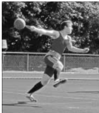
Die Tageshöchstweite von 55,38 Metern bedeuteten den Meistertitel im Schleuderball.

Dennoch konnte er mit sehr ansprechenden Leistungen überzeugen. Zu Beginn des Mehrkampfes stieß er die 7,26Kg schwere Kugel auf 10,95 Meter. Mit dem 1,5 Kg schweren Schleuderball erreichte er 54,18 Meter. Beim 100 Meter Lauf blieb die Uhr bei 11,82 Sekunden stehen. Im Weitsprung erreichte er 6,10 Meter. Für den abschließenden 2000 Meter Lauf benötigte er 8:07,21 Minuten. Mit 53,30 Punkten bedeuteten diese Leistungen die Baden-Württembergische Vizemeisterschaft und die klare Qualifikation für die Deutschen Meisterschaften.