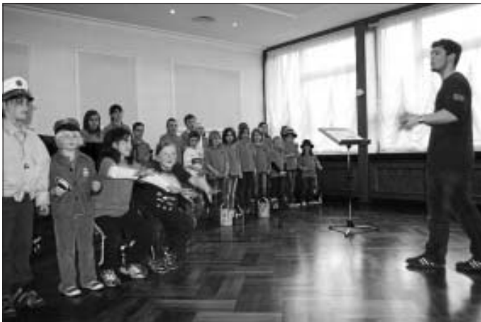
Die Liederkranz-Spatzen in Aktion