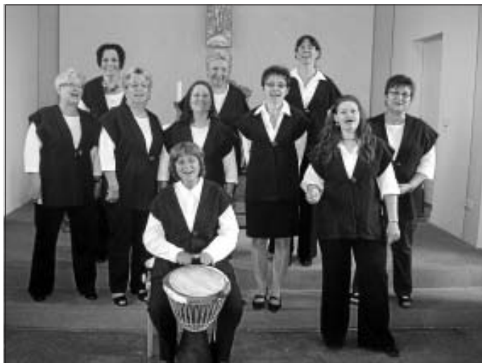
Frauenchor Tiritomba im Gottesdienst vergangenen Sonntag