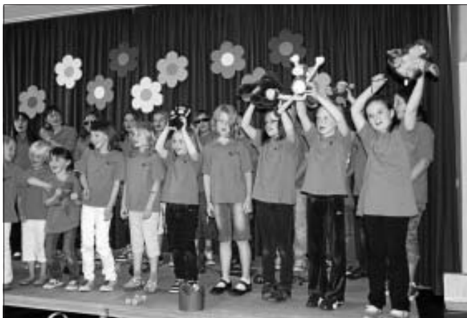
Viel Freude am Gesang...