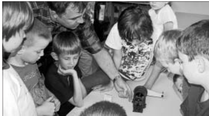
Begeisterte Kinder bei einer der vielen Eltern-AGs