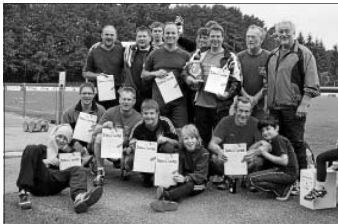
Die strahlenden Teilnehmer des Indiaca- und Volleyballturniers des TVA bei der Siegerehrung

Am 13. Juni traf sich die Sportlerfamilie des TV Altburg zum diesjährigen Sportfest und veranstaltete ein Volleyball- und Indiaca Turnier auf dem Sportplatz in Altburg. Beim Indiaca Turnier spielte 5 Mannschaften miteinander und beim Volleyball waren es 8 Mannschaften. Auf dem Sportplatz entwickelte sich ein frohes, buntes Bild. Alle hatten an diesem Nachmittag Ihren Spaß beim Sporttreiben und beim gemeinsamen Feiern.