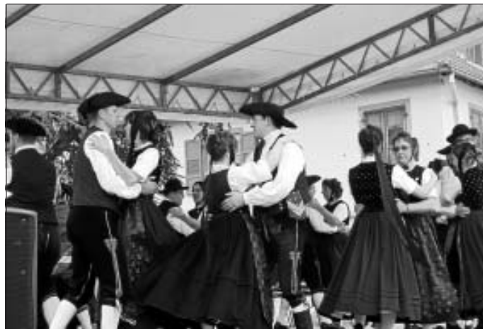
Die Trachtengruppen beim Auftritt neben dem Rathaus

das dort traditionelle Kirschenfest stattfand. Nach einem Empfang vor dem Rathaus gab es ein Mittagessen in der Sporthalle. Wir bekamen Sauerkraut mit Würsten, Fleisch und Salzkartoffeln. Anschließend ging es zur Festzugaufstellung. Der Festzug, an dem u.a. auch die Miss Elsass teilnahm, führte uns dann wieder zum Rathaus, wo auf einer Bühne anschließend ein halbstündiger Auftritt der beiden Gruppen stattfand. Bis zur Rückreise hatten wir noch etwas Zeit, die Angebote auf dem Fest zu genießen oder die vielfach angebotenen Kirschen zu probieren. Die anschließende Rückfahrt klappte ohne Stau, sodass wir pünktlich zum Fußballspiel wieder zu Hause waren.