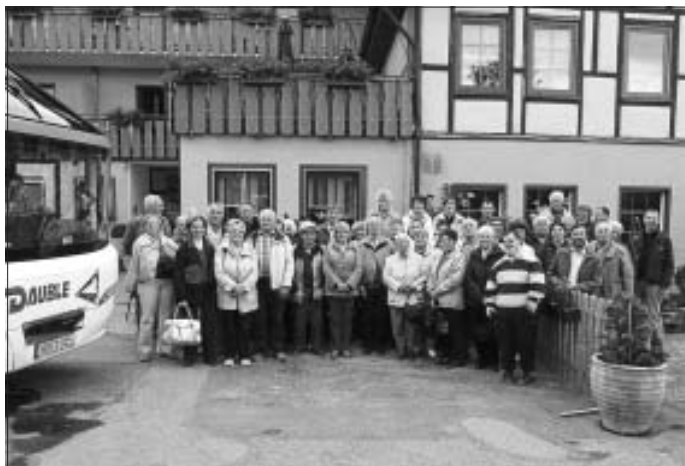
Abschluss in Marschalkenzimmern