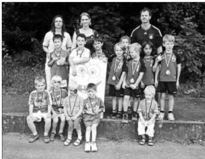
Hirsauer Minis + Maxis mit Betreuersteam

Ein Dank geht natürlich an alle Helfer/innen, die in irgendeiner Form zum Gelingen dieses Tages beigetragen haben und an die Mannschaften, die uns mit ihrer Anwesenheit treu geblieben sind! (Bericht Melanie Krotz)