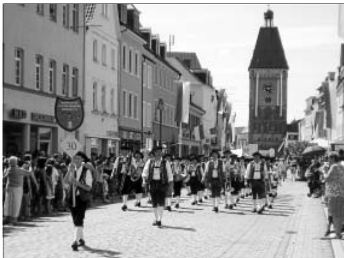
Die Altburger marschierten im Brezelfestumzug durch die Altstadt von Speyer.

Dieses Wochenende ist die Trachtenkapelle Samstagabend zu Gast beim Rettichfest in Neubulach und Sonntagnachmittag im Festzelt beim Schäferlauf in Wildberg.