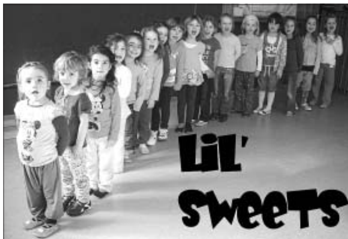
Die Lil' Sweet's freuen sich auf ihren ersten Wettbewerb.

Mit dabei sind die kleinsten "LiL' Sweet's" im Alter von 4 bis 7 Jahren, die "CRUSH KIDS" im Alter vom 7 bis 9 Jahren, die "THANXS" im Alter von 10 bis 12 Jahren und die "AMOUNT GIRLZ" im Alter von 13 bis 19 Jahren.