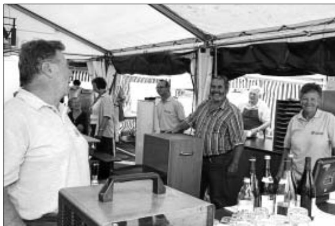
Schönes Wetter und nette Gäste - das macht Freude!

Allen Helfern möchten wir auf diesem Weg ein aufrichtiges Dankeschön sagen. Es hat mal wieder alles wie am Schnürchen geklappt. Die Vorstandschaft