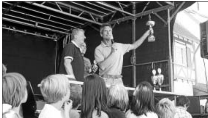
Siegerehrung bei der Mauricholympiade

Wir möchten uns ganz herzlich bei allen Gästen bedanken, die den Stand des Obst- und Gartenbauvereins beim Fleckenfest besucht haben. Vor allem am Sonntag waren bei schönem Wetter alle Plätze belegt und unsere Spezialitäten wie Steinchampignons, griechischer Salat oder Holunderblütenbowle wurden reichlich ver-