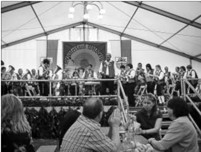
Bildnachlese Wildberger Schäferlauf vom 18. Juli.

Kommenden Sonntag ist die Trachtenkapelle wieder in Enzklösterle zu Gast. Mit dem Kurkonzert verabschieden sich die Musiker/innen in die Sommerpause. Danach geht es im September zur Konzertreise nach Portugal, worüber noch ausführlich berichtet wird.