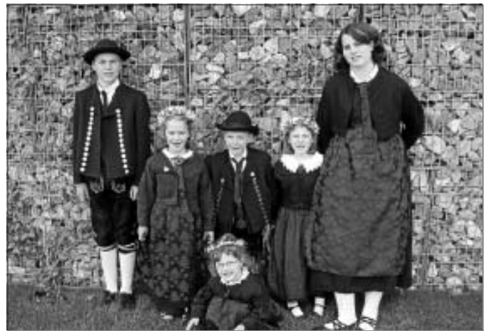
Unsere Trachtenkinder nach dem Umzug.

Die Proben beginnen wieder am Donnerstag 16.09. für die Kinder um 17.30 Uhr und für die Erwachsenen um 20 Uhr im Rathaus in Altburg. Unsere Auftritte und sonstigen Aktivitäten können Sie auch auf unserer Homepage: Trachtengruppealtburg.de erfahren.