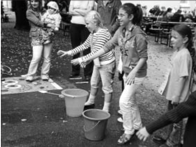
Lustige Spiele gab es beim Sommerfest.

luden Kinder zu verschiedenen sportlichen Aktivitäten ein. Auch wenn das harmonische und kurzweilige Beisammensein wegen eines Regenschauers etwas eher als geplant zu Ende ging, so zeigte die Resonanz: Das Fest hat allen Spaß gemacht! Das Grundschulteam bedankt sich bei allen Auf- und Abbauhelfern und den Eltern für ihre Unterstützung bei den Spielstationen und dem Büfett. Wir freuen uns auf ein nächstes Mal und laden alle herzlich ein, unsere Homepage mit den aktuellen Bildern zu besuchen.