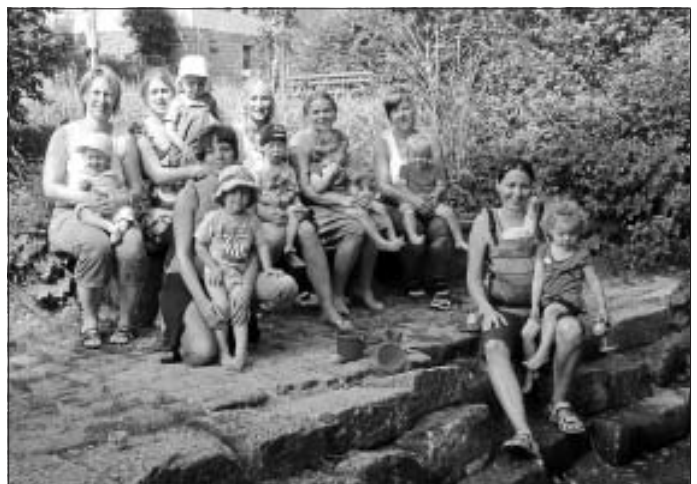
Die Mini-WeSpen verabschieden sich