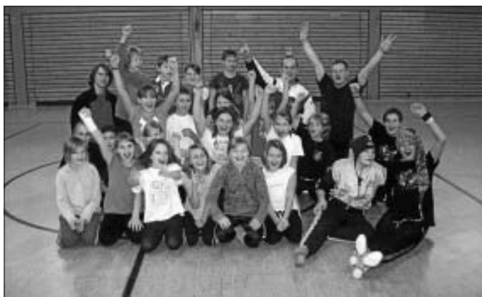
Die Teilnehmer am Trainingslager 2010 haben ein Wochenende mit viel Spaß und Aktion hinter sich.

Um 13.30 Uhr ging es mit einem Leistungstest los, bei dem Ausdauer, Kraft und Dehnbarkeit der Turner und Turnerinnen auf die Probe gestellt wurden. Anschließend begannen die Übungsleiter mit ihren jeweiligen Gruppen das Trainieren von alten und neuen Turnelementen. Sehr erschöpft und hungrig stürzten sich danach die Turner auf die Partypizzas die im Vereinsraum bereitstanden. Außer einem kleinen Stück wurde alles komplett leer gegessen. Mit neuer Kraft und vollem Bauch durften die Wettkämpfer nun in kleinen Teams jeweils eine kleine Aufführung einüben, wofür sie 45 Minuten Zeit hatten.