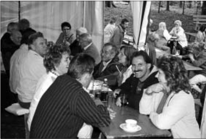
Beim Waldfest trifft man sich zum angeregten Plausch

Kontaktadresse: Erika Haug, Tel. 07051 2524