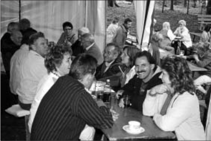
Beim Waldfest trifft man sich zum angeregten Plausch

Kontaktadresse: Erika Haug, Tel. 07051 2524