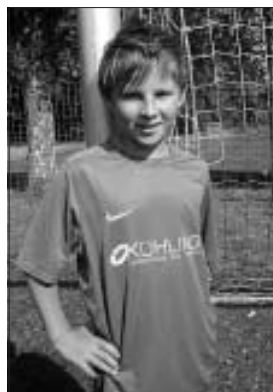
Wir danken für die Ausstattung unserer D-Jugend mit neuen Trikots. Unseren Jugendlichen wünschen wir viele Erfolge mit dem neuen Dress.

F-Junioren ab 9:30 Uhr Spieltag in Calw (Stadion) E-Junioren 13:00 Uhr VfL Stammheim I - FC A/W D-Junioren 13:15 Uhr FC A/W - JSG Hengstett II C-Junioren 14:45 Uhr FC A/W - VfL Stammheim I B-Junioren 16:00 Uhr SGM VfL Stammheim II - FC A/W A-Junioren 16:00 Uhr SGM FC Neuweiler - SGM Spvgg Bad Teinach-Zavelst.-FC Alzenberg-Wimberg