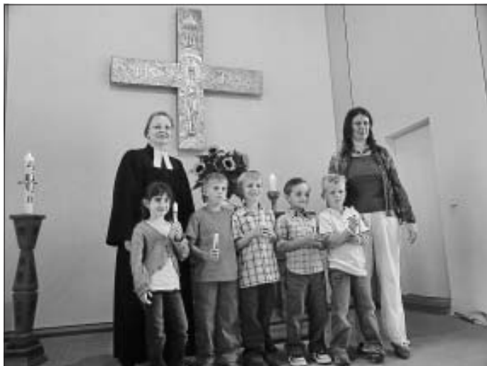
Segnungsgottesdienst für Jung und Alt mit Kindern aus Holzbronn, die in die erste Klasse gekommen sind

Am Sonntag, 3. Oktober feiern wir um 10 Uhr das Erntedankfest mit dem Kindergarten und der Kirchenband. Nach dem Gottesdienst lädt die Kirchengemeinde und der Obst- und Gartenbauverein ganz herzlich zu einem leckeren Mittagessen in den Gemeindesaal ein. Am Samstag davor wird der Erntedankaltar gerichtet. Ab 9 Uhr können Erntegaben im Vorraum der Kirche abgegeben werden, um den Erntedankaltar zu gestalten.