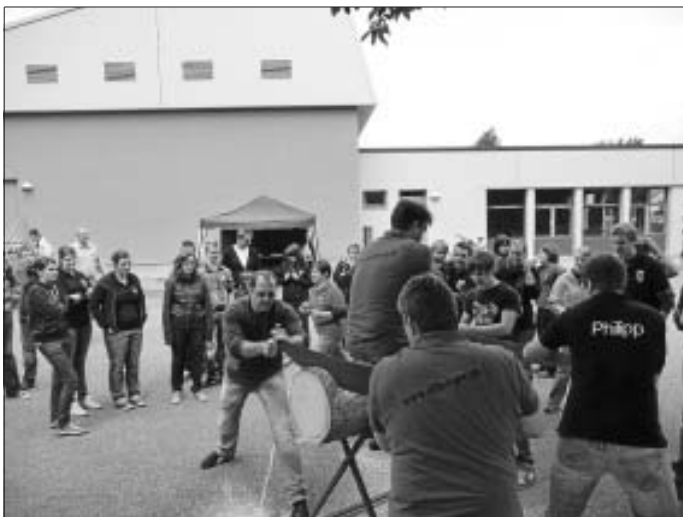
Vertreter der Trachten- und der Stadtkapelle beim Holzsägewettbewerb.