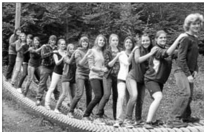
Unsere B-Mädchen bei der Saisonvorbereitung