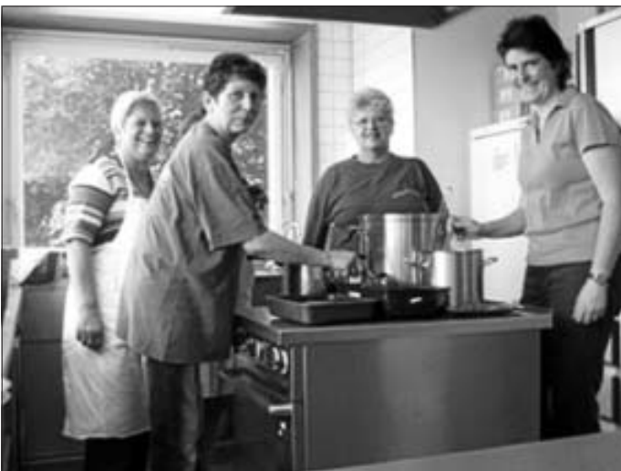
Der schwäbische Sonntagsbraten war ein Gedicht

Wir sagen wieder "Danke" an die Sterne-Köche unseres Küchenteams, denn ohne sie wären wir nicht so erfolgreich!