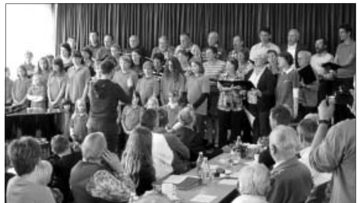
Der Liederkranz beim letzten Herbstfest in Aktion