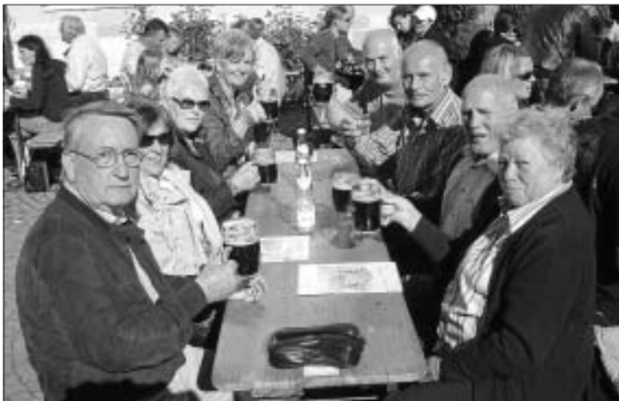
Schaumkrönender Abschluss beim Kloster Weltenburg

Knapp 40 Vereinsmitglieder machten sich letztes Wochenende auf nach Regensburg. Kulinarisch und kulturell ein echter Leckerbissen sowie beste Stimmung bei weiß-blauem Himmel - so kann man die 2 Tage kurz zusammenfassen. Bevor's wieder Richtung Heimat ging, wurde noch das weltmeisterliche Bier der Weltenburger Klosterbrauerei verkostet, wo auch das Foto entstand.