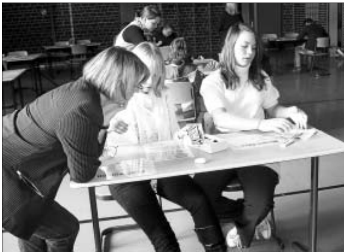
An verschiedenen Stationen konnte jeder seine Begabungen entdecken.

Nachdem alle mit viel Spaß und Konzentration bei der Sache waren, stand am Ende des Vormittages noch die Auswertung auf dem Programm, die hoffentlich allen bei ihrer weiteren "Orientierung in Berufsfeldern" hilft, nach dem passenden Praktikumsplatz zu schauen.