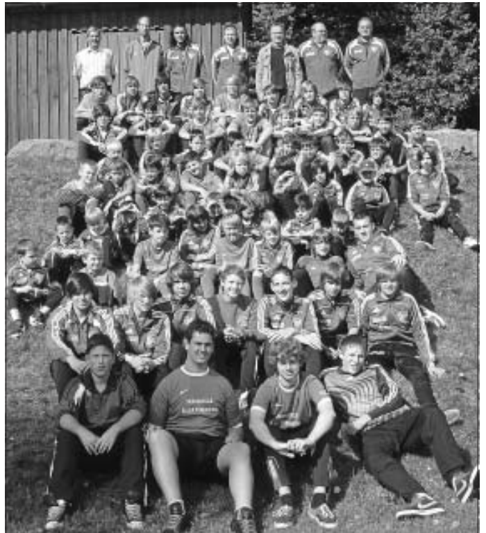
Wir freuen uns auf Ihren Besuch

15.30 Uhr A-Jugend 1. FC Egenhausen - SGM Spvgg Bad Teinach-Zavelst./FC Alzenberg-Wimberg