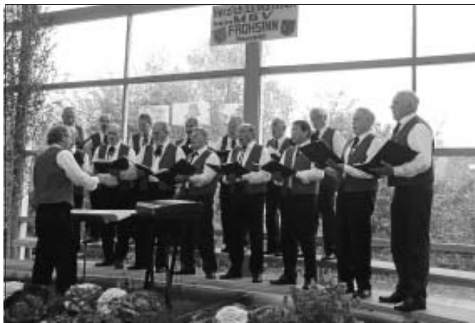
Auftritt in Neuweiler

Es war ein sehr gemütlicher Nachmittag. Wir konnten den Vorträgen der anderen Chöre lauschen und dabei das eine oder andere Viertel, Kaffee und leckeren, selbstgebackenen Kuchen oder Zwiebelkuchen mit Neuem Wein genießen. Mit dem Versprechen, die freundschaftliche Beziehung weiter zu pflegen, verabschiedeten wir uns am frühen Abend dann von den Neuweiler Sängern.