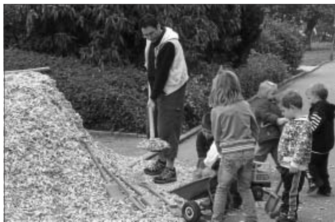
So macht Veränderung Spaß!

Ja und die Hackschnitzel, Fallschutz unter der Schaukel, die haben die Kinder eigenhändig mit Schubkarren, Lastwagen und Eimern an Ort und Stelle verfrachtet.