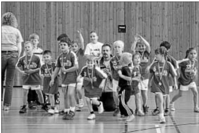
Spaß an Bewegung spielerisch vermittelt

Letztes Wochenende, am 24. Oktober, sind 12 hochmotivierte Spieler und Spielerinnen des TSV Hirsau nach Leonberg gefahren, um am Mini-Spieltag teilzunehmen. Beim Handball, Königsball und Indiball zeigten sie was sie im Training gelernt hatten. Ihre Geschicklichkeit konnten sie beim Staffellauf und auf dem Kletterparcours unter Beweis stellen. Für ihre gute Leistung durften alle Kinder stolz eine Medaille entgegennehmen.