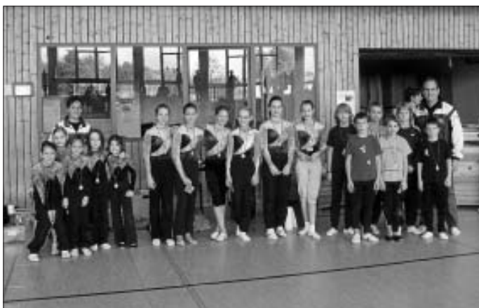
Alle Teilnehmer bei der Siegerehrung

Allen Turnerinnen und Turnern gratulieren wir ganz herzlich zu ihren Leistungen. Ebenso bedanken wir uns bei allen Trainern, Kampfrichtern und Eltern für die Unterstützung im Wettkampfsjahr 2010. Wir werden uns ab jetzt auf die Wettkämpfe im Jahr 2011 vorbereiten.