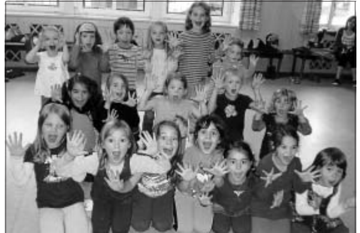
Viel Spaß beim Üben und wir freuen uns auf eure Vorstellung von "Lil' SweetTs - Aschenbrödel".

Die Kleinen wollen so schnell wie möglich wieder auf eine Bühne, erst im Juli belegten sie den 1. Platz bei einem Wettbewerb.