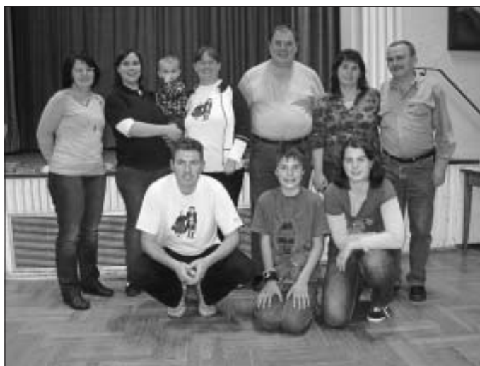
Die Teilnehmer am Tanzlehrgang in Schönmünzach

Zum diesjährigen Tanzlehrgang in Schönmünzach sind wir mit acht Tänzerinnen und Tänzern angereist. Auch unsere jugendlichen Teilnehmer durften dieses mal mit den Erwachsenen mittanzen und hatten viel Spaß dabei. Es wurden wie immer neue Tänze wie der "Wolgaster" und der "Camp Town Racers" vorgestellt und einstudiert. Aber auch bekannte Tänze wurden wiederholt, die im Trachtengau vielleicht noch nicht jeder kennt. Nach dem Abendessen gab es wie immer ein offenes Volkstanz, wo alle Teilnehmer ihre Wünsche äußern konnten und auch vergessene Tänze wieder neu aufgefrischt wurden.