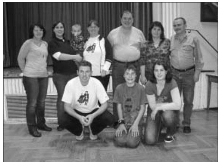
Die Teilnehmer am Tanzlehrgang in Schönmünzach

Zum diesjährigen Tanzlehrgang in Schönmünzach sind wir mit acht Tänzerinnen und Tänzern angereist. Auch unsere jugendlichen Teilnehmer durften dieses mal mit den Erwachsenen mittanzen und hatten viel Spaß dabei. Es wurden wie immer neue Tänze wie der "Wolgaster" und der "Camp Town Racers" vorgestellt und einstudiert. Aber auch bekannte Tänze wurden wiederholt, die im Trachtengau vielleicht noch nicht jeder kennt. Nach dem Abendessen gab es wie immer ein offenes Volkstanz, wo alle Teilnehmer ihre Wünsche äußern konnten und auch vergessene Tänze wieder neu aufgefrischt wurden.