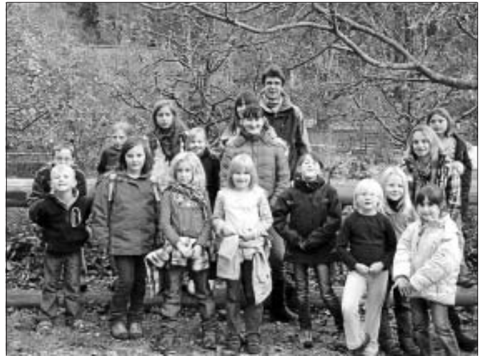
Nach schöner Wanderung zur Xanderklinge

Der Kinderchor probt in dieser Woche wie angekündigt nicht. Wir treffen uns alle am 19.11. zur nächsten Probe um 17.30 Uhr.