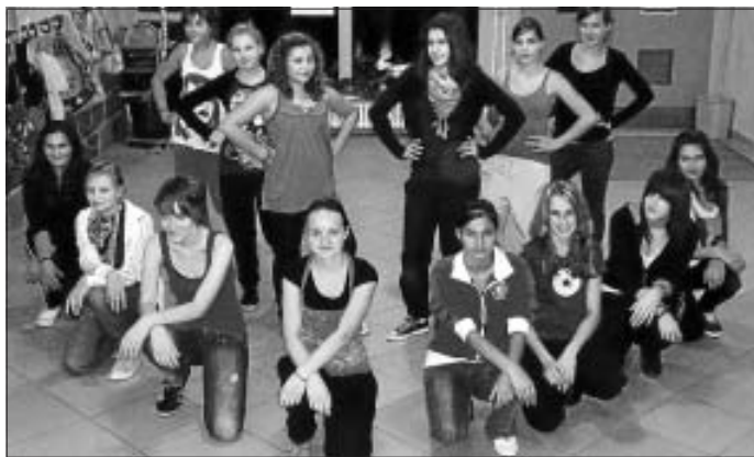
Die neu formierte Gruppe BREEZE IN

Bei der Weihnachtsfeier des TV Altburg am 12. Dezember interpretieren BREEZE IN gemeinsam mit der Gruppe DA JUMBLE den Tanzfilm FAME.