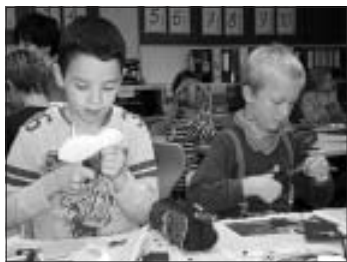
Beim Basteln waren alle eifrig dabei.

Da haben sich die Wimberger Grundschul Kinder wohl ein Beispiel am Weihnachtsmann genommen: Schon frühzeitig machten sie sich auf, um für die schönste Zeit des Jahres vorbereitet zu sein. Am Montag, dem 22. November, herrschte im Gebäude der Grundschule ein eifriges Treiben. Alle Kinder tummelten sich in den verschiedenen Klassenräumen, um an den zahlreichen Bastelstationen liebevoll den Weihnachtsschmuck für ihr Schulgebäude herzustellen.