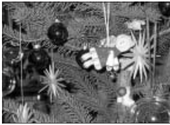
Advent in Holzbronn

Chor, Bläsern des Musikvereins Stammheim und einer Flötengruppe. Dazu werden Glühwein, Punsch und Rote Wurst sowie vom Holzbronner Kindergarten Waffeln angeboten. Wir freuen uns auf eine schöne Adventsstimmung mit vielen Holzbronnern und Gästen!