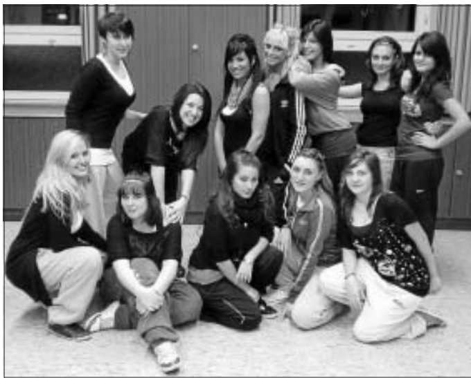
Die neue Besetzung von DA JUMBLE

Einige Tänzerinnen haben uns aus persönlichen Gründen verlassen, andere wiederum aus Zeitgründen. Doch nach langem Suchen haben sich 12 motivierte Mädchen gefunden. Premiere des Meisterschaftstanzes "Speed" kann man während der Weihnachtsfeier am Samstag, den 11.12. sehen.