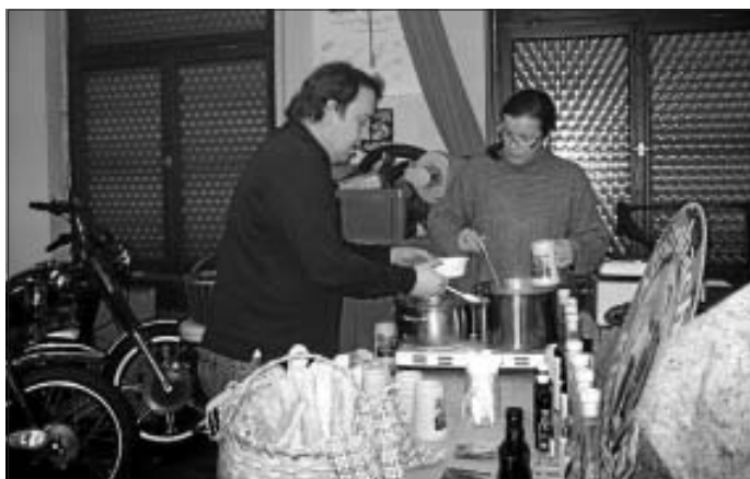
Beim monatlichen Stammtisch des Motorrad Veteranen Clubs Calw-Stammheim e.V. am 29. Januar im Vereinsheim kamen bei