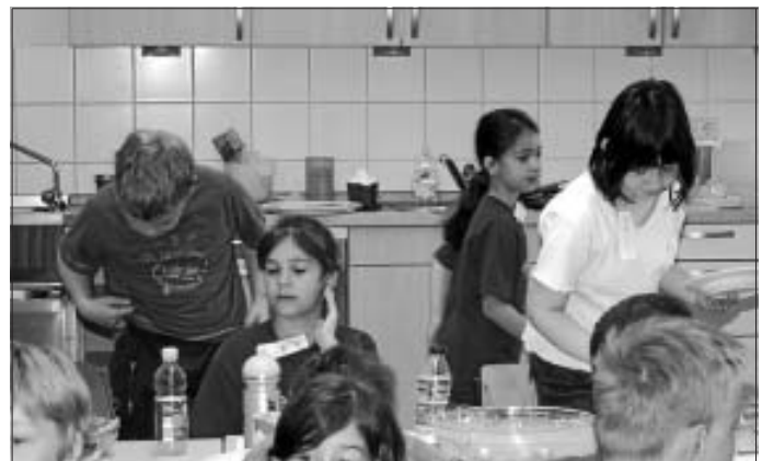
Helferinnen und Helfer gesucht!