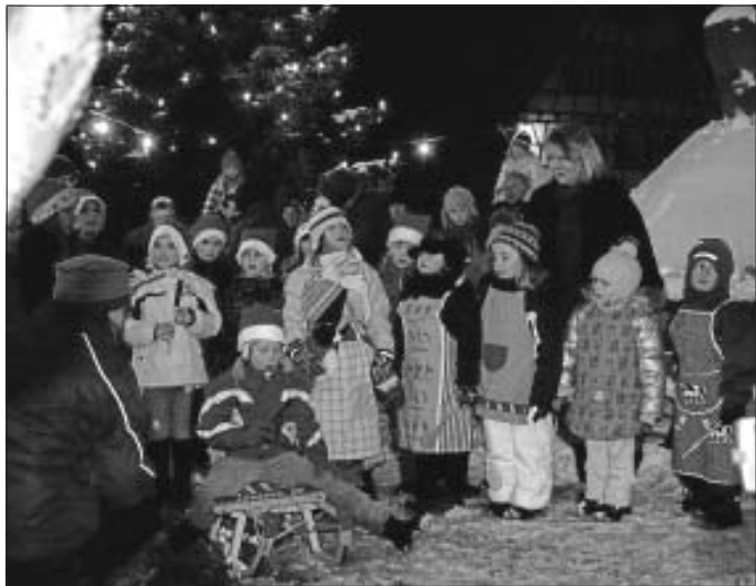
Die Kinder bei der Weihnachtsbäckerei