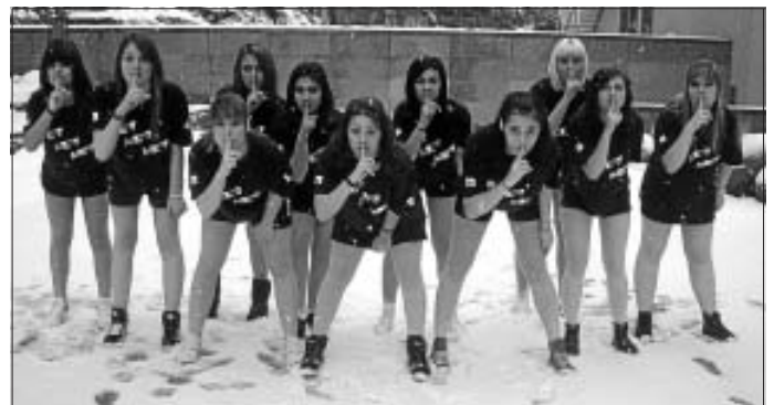
"Pssst - Das neue Programm wird erst beim Fasching verraten!" Auf ein gutes Gelingen!

Am 16. Februar wird die Formation DA JUMBLE des TV Altburg während der Faschingsfeier in der Altburger Schwarzwaldhalle auftreten. Es finden zwei Aufführungen jeweils um 20.30 Uhr und um 21 Uhr statt. Es ist für die Mädels die Generalprobe vor dem ersten Tanzwettbewerb.