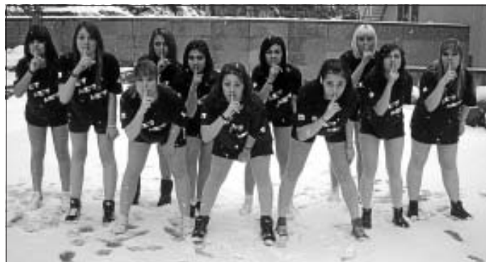
"Pssst - Das neue Programm wird erst beim Fasching verraten!" Auf ein gutes Gelingen!

Am 16. Februar wird die Formation DA JUMBLE des TV Altburg während der Faschingsfeier in der Altburger Schwarzwaldhalle auftreten. Es finden zwei Aufführungen jeweils um 20.30 Uhr und um 21 Uhr statt. Es ist für die Mädels die Generalprobe vor dem ersten Tanzwettbewerb.