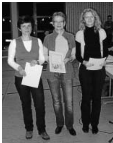
U. Rosenfelder, E. Jerger, H. Dunst

Kontaktadresse: Georg Stoll 07051 50802, weitere Infos unter www.1altburg.de