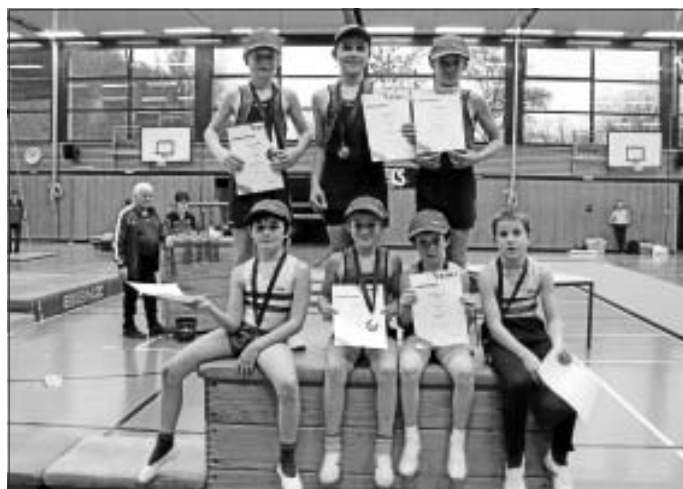
Alle Turner zeigen stolz ihre Urkunden und Medaillen

Wir danken allen Eltern, Trainern und Kampfrichtern, die am Sonntag in Nagold dabei waren.