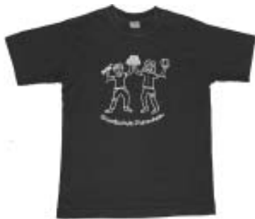
Wollt auch Ihr stolze Besitzer eines solchen Shirts sein?

Sportwettbewerb, Ferienkreis, Schulfest, Fleckenfest - es gibt viele Gelegenheiten, um für seine Grundschule "Flagge zu zeigen". Durch das Tragen eines Schul-T-Shirts kann jede/r Schüler/in zeigen "wir gehören zusammen", "wir haben dieselben Werte", "wir gehören zur Grundschule Stammheim". Aus diesem Grund gibt es auch an unserer Grundschule seit einiger Zeit ein Schul-T-Shirt.