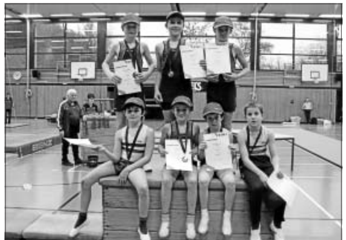
Alle Turner zeigen stolz ihre Urkunden und Medaillen

Wir danken allen Eltern, Trainern und Kampfrichtern, die am Sonntag in Nagold dabei waren.